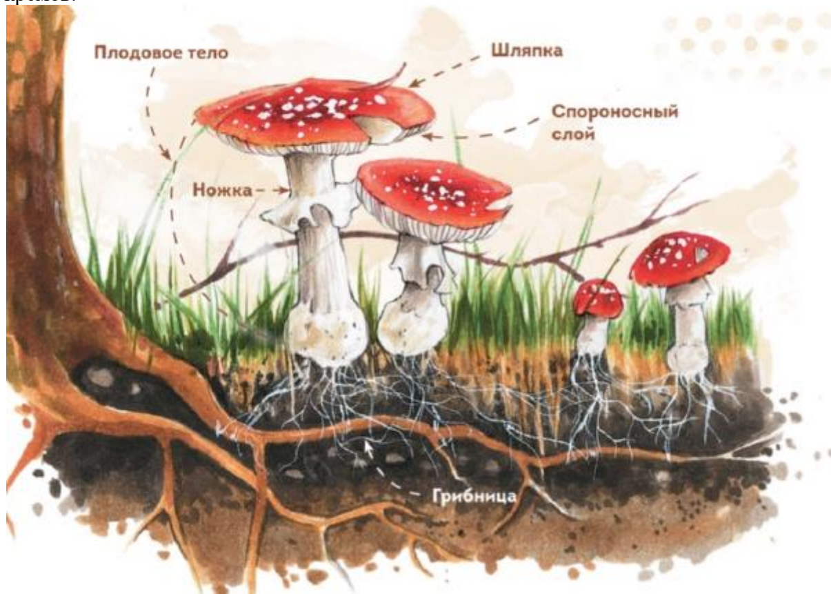
Иллюстрация из книги «Грибы»

Ничто в мире не сравнится с собиранием грибов — занятием, которое многим знакомо с детства. Можно узнать столько всего нового! Только не забудьте взять книгу «Грибы», в которой собрано много потрясающих фактов о грибах. Вы узнаете, что некоторые грибы умеют охотиться и светиться, а какие-то грибы используют для создания шампуней и кремов.