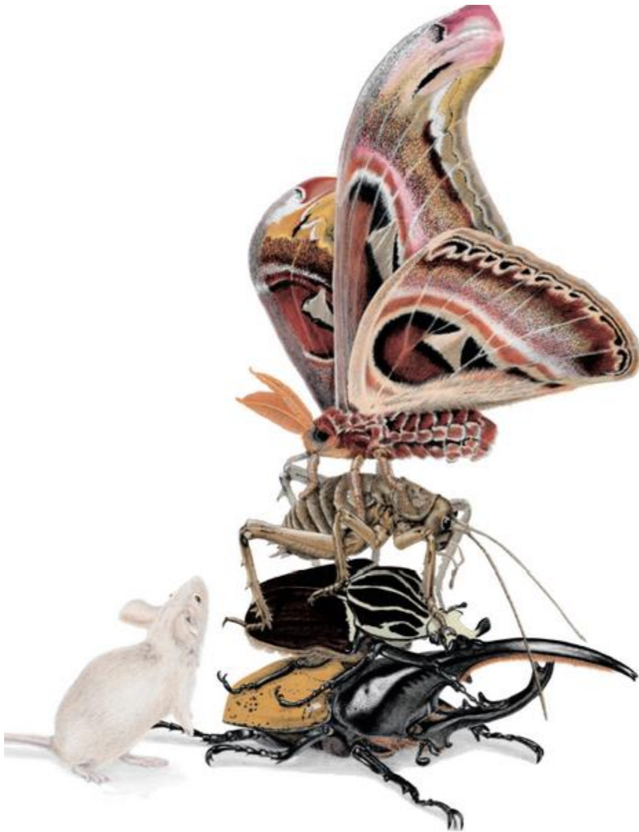
Иллюстрация из книги « Поразительные насекомые »

Вы узнаете, что самое маленькое насекомое — это Оса-фея Динь-Динь, самое больше — жук-голиаф, среди чемпионов по пряткам есть гусеницы, которые притворяются саламандрой, птичьим пометом и даже игрушкой для ванны. Ух!